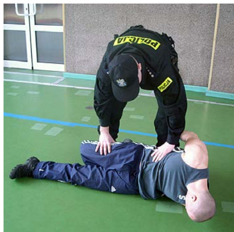
Sprawdza drugi bok.