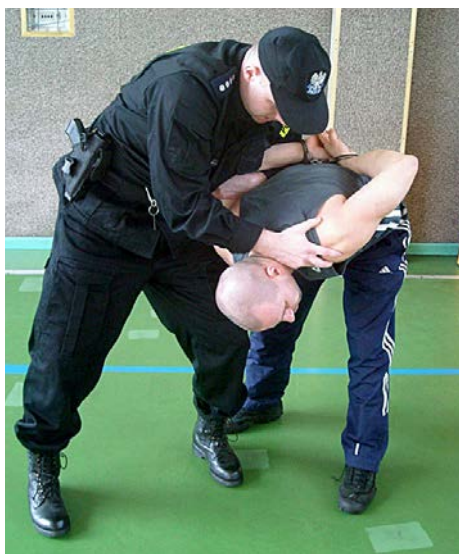
Następnie odprowadza zatrzymanego.