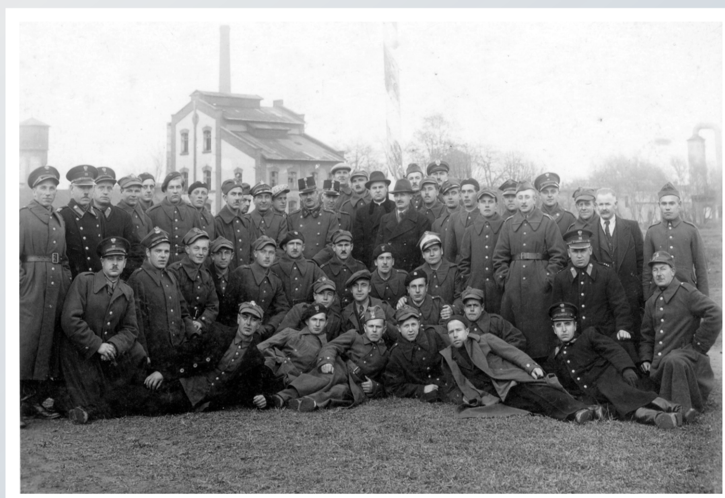
Funkcjonariusze Policji Województwa Śląskiego i Policji Państwowej oraz podoficerowie Wojska Polskiego w obozie dla internowanych w Sárvár na terenie zachodnich Węgier. Wiosna 1940 roku.