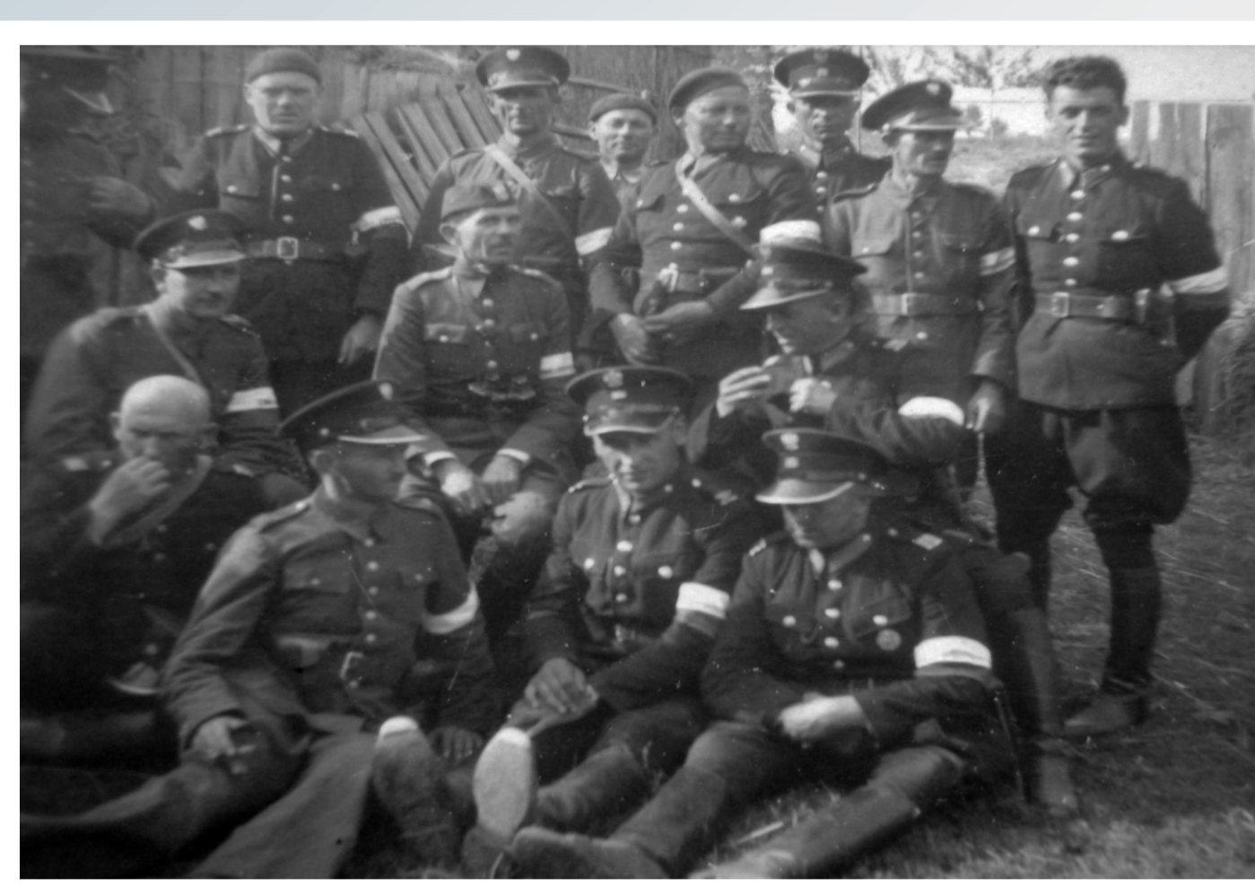
Policjanci w trakcie odwrotu z województwa śląskiego na wschód, do punktów koncentracji wyznaczonych dla Policji Województwa Śląskiego w Tarnopolu i Mostach Wielkich. 2 września 1939 roku.