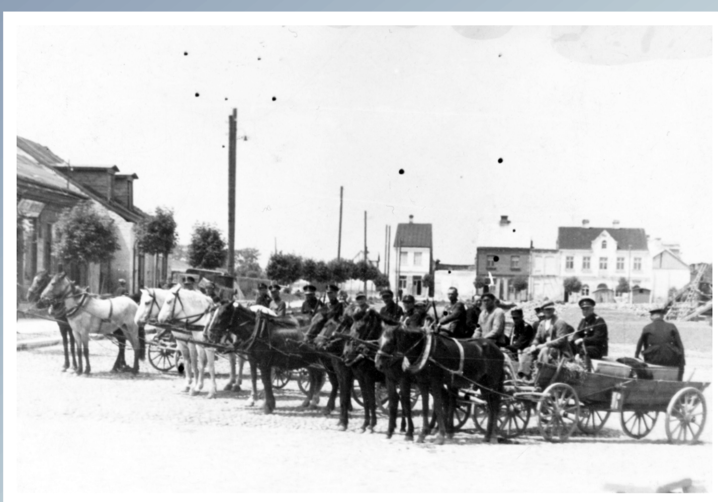
Wozy taborowe Głównej Komendy Policji Województwa Śląskiego w trakcie odwrotu ze Śląska na Rynek w Zwoleniu. Wrzesień 1939 roku.