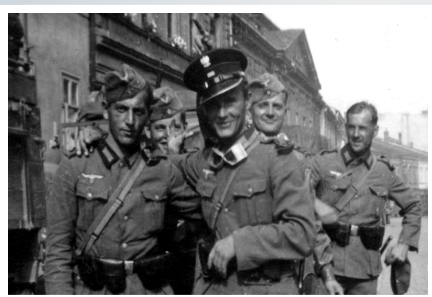
Żołnierz Wehrmachtu na jednej z bielskich ulic z „trofeum wojennym” na głowie – czapkę służbową posterunkowego PwŚł.