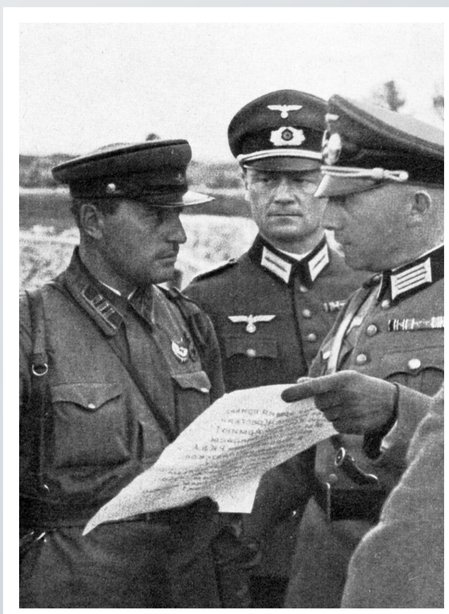
Spotkanie oficerów Wehrmachtu i Armii Czerwonej w rejonie Luwowa. Wrzesień 1939 roku.