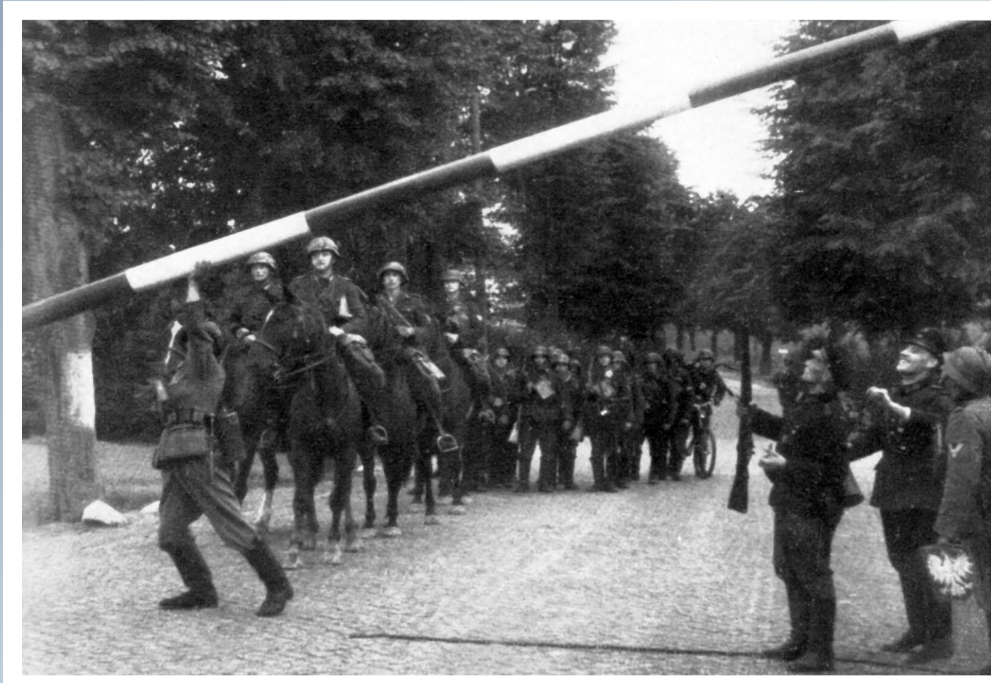
Żołnierze Wehrmachtu przekraczają granicę polsko - niemiecką, województwo śląskie pow. rybnicki. 1 września 1939 roku.