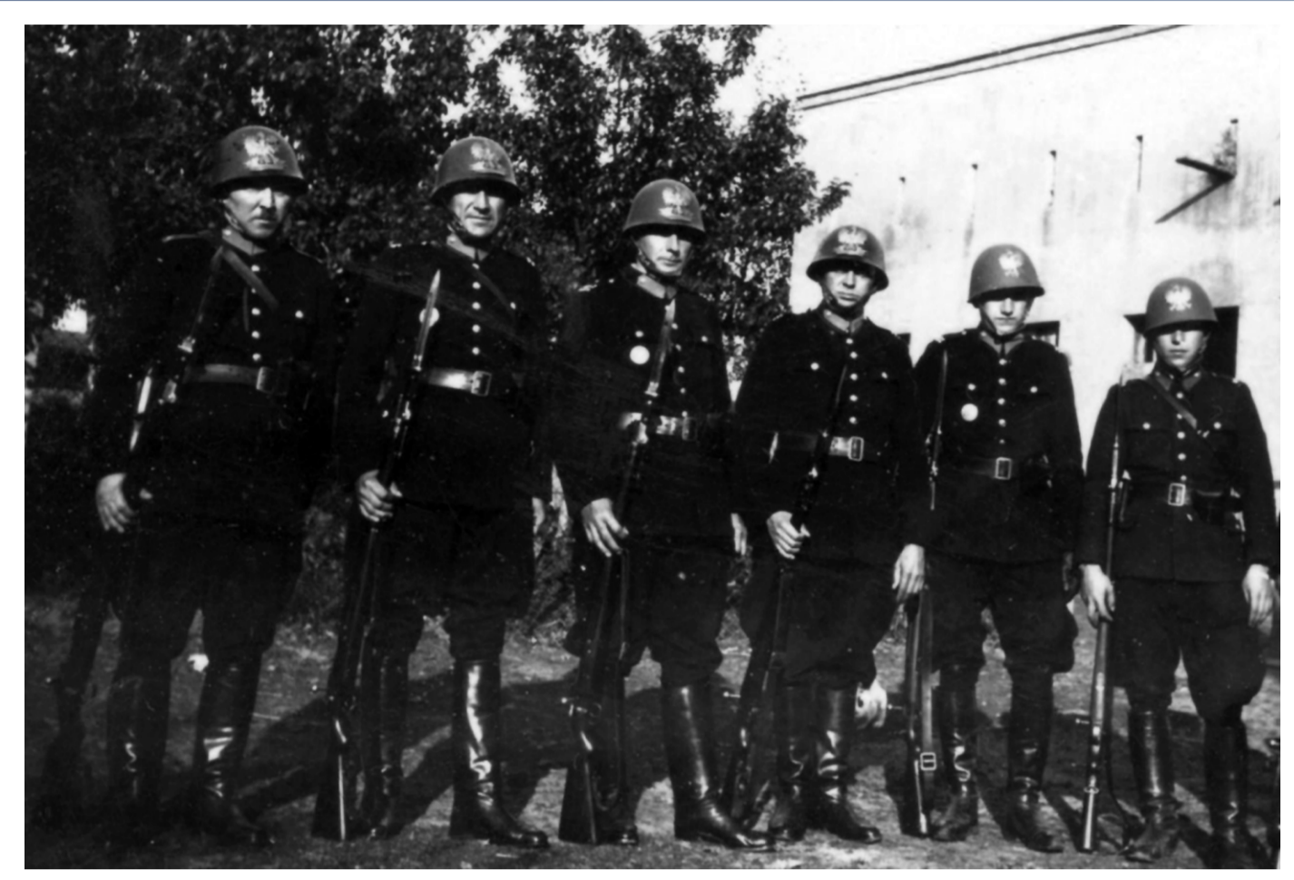
Funkcjonariusze PWSł. z Posterunku Granicznego w Łagiewnikach k / Chorzowa. Fotografia wykonana w przededniu wybuchu II wojny światowej, 31 sierpnia 1939.