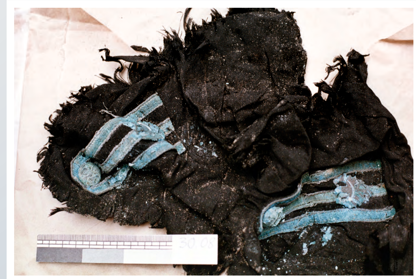
Kurtka mundurowa starszego przodownika PWSL, wydobyta z „dolu śmierci” w Miednoje w trakcie prac badawczo - ekshumacyjnych. Sierpień 1991 roku.