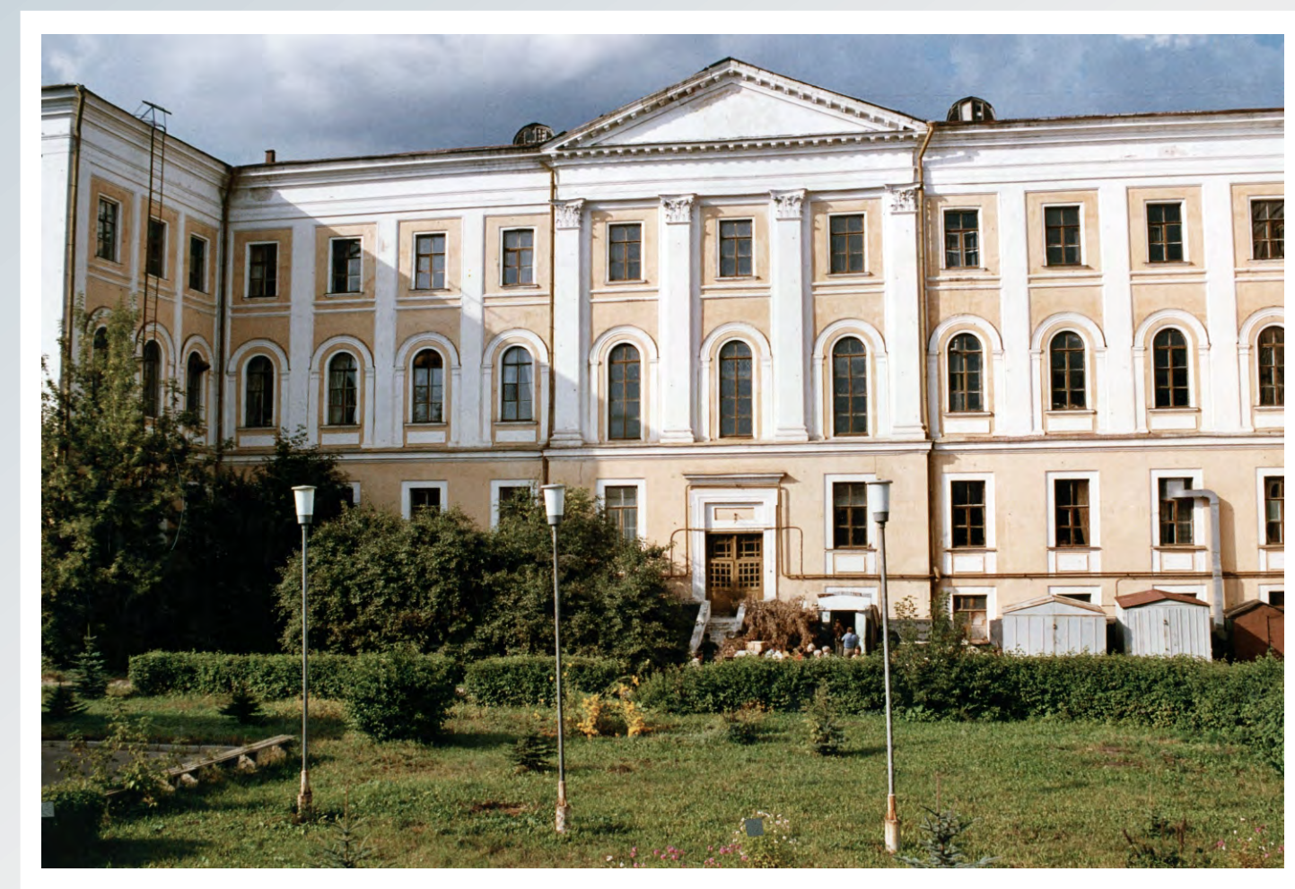
Budynek byłej siedziby Obwodowego Zarządu NKWD w Kalininie (obecnie Twer). W okresie od 4 kwietnia 1940 roku do 19 maja 1940 roku funkcjonariusze NKWD zamordowali w piwnicach tego budynku 6 311 polskich jeńców wojennych z Obozu Specjalnego NKWD w Ostaszkanie. Lata 90 XX wieku.