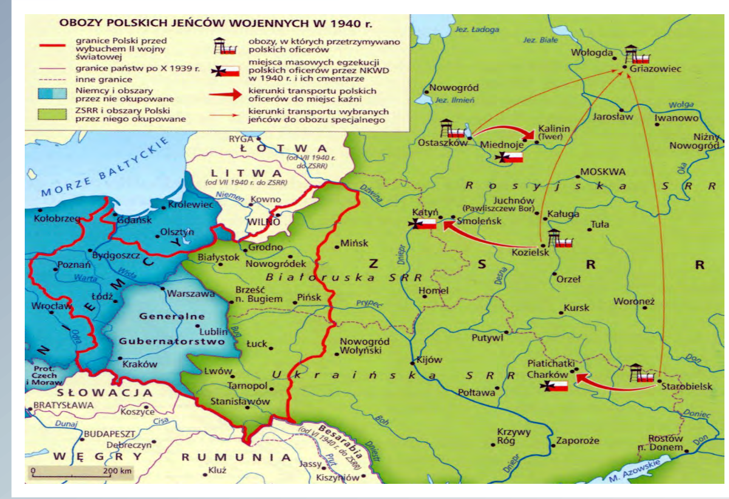
Szkie położenia Obozów Specjalnych NKWD w 1940 roku dla polskich jeńców wojennych na terenie ZSRR.