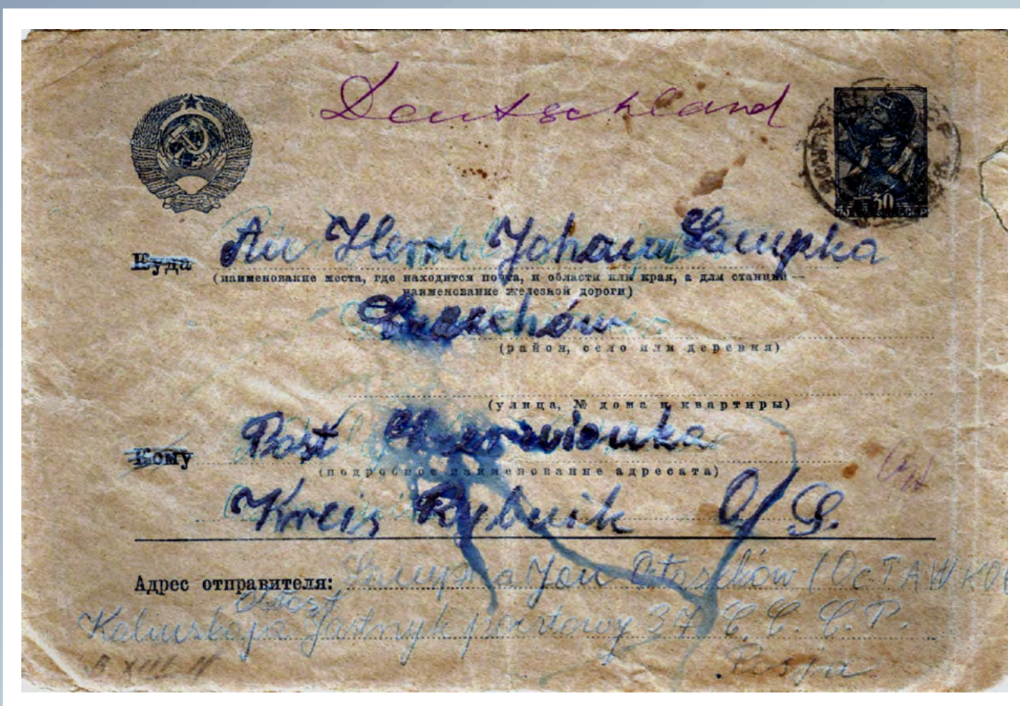
Koperta listu wysłanego przez funkcjonariusza Policji Województwa Śląskiego - jeńca Obozu Specjalnego NKWD w Ostaszkanie - w grudniu 1939 roku do rodziny na Śląsku.