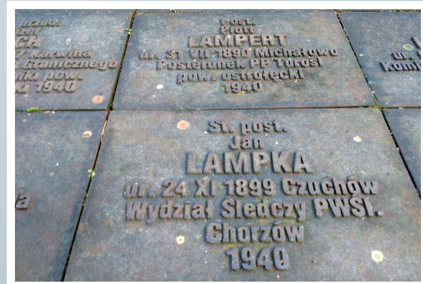
Tabliczki epitafijne na Polskim Cmentarzu Wojennym w Miednoje (Rosja).