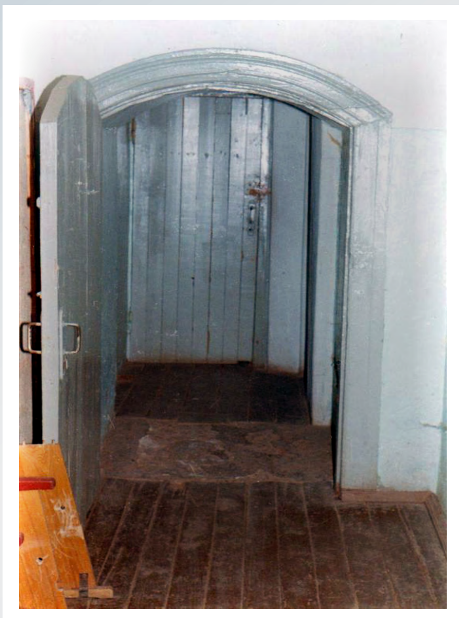
Wejście do celi śmierci w piwnicy budynku byłej siedziby Obwodowego Zarządu NKWD w Kalininie (obecnie Twer).