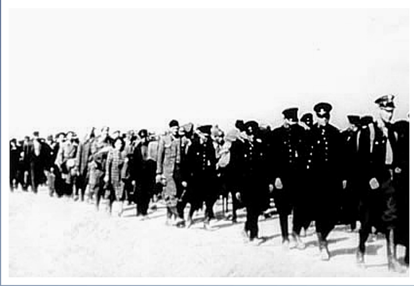
Kolumna polskich policjantów - jeńców wojennych w drodze do sowieckich obozów, więzień i łagrów. Obecnie historycy szacują, że Sowieci wymordowali ponad osiemdziesiąt procent stanu osobowego PWSL.