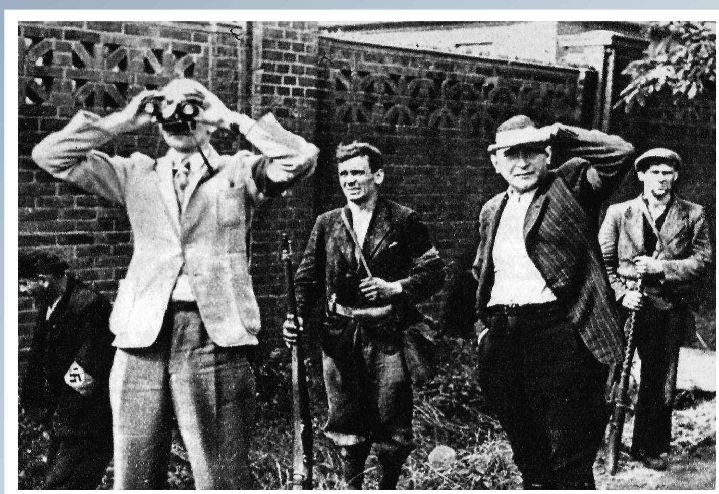
Freikorps Ebbinghaus - niemiecka formacja bojowo-dywersyjna. Oddziały Freikorpsu atakowały posterunki graniczne i celne oraz przygraniczne miejscowości, kopalnie i hutę na terenie województwa śląskiego.