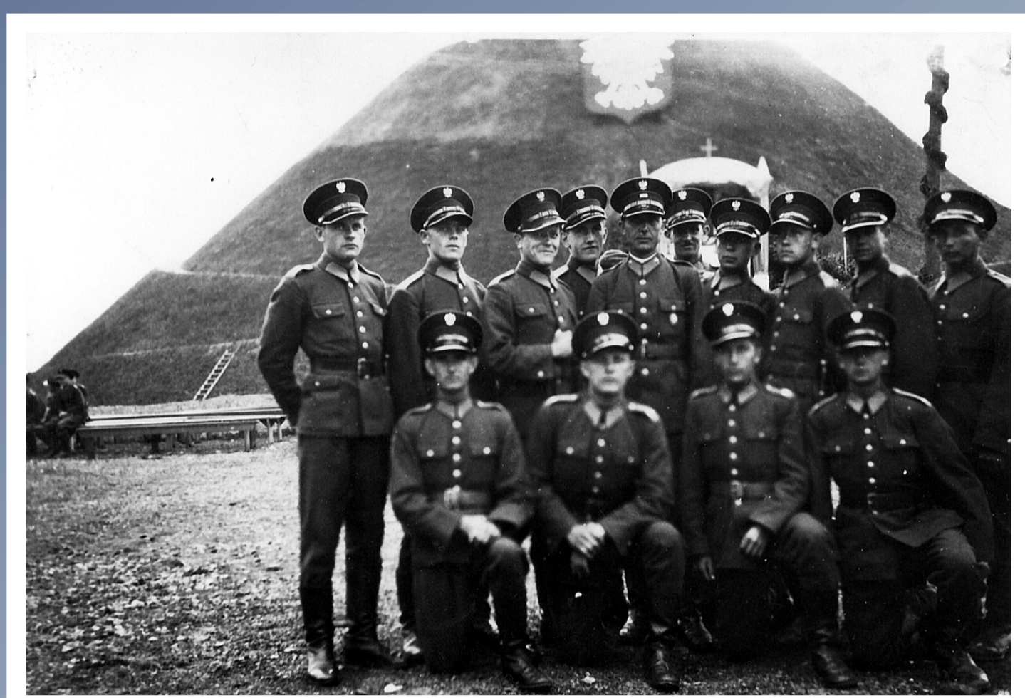
Funkcjonariusze kompanii szkolnej Komendy Rezerwy PWŚl. w Katowicach. Śląscy policjanci od 23 sierpnia 1939 r. walczyli z oddziałami Freikorpsu Ebbinghaus, broniąc granic państwa w Górnośląskim Rejonie Przemysłowym. Policjanci do 3 września 1939 r. stoczyli cztery bitwy i ponad czterdzieści potyczek z niemieckimi dywersantami.