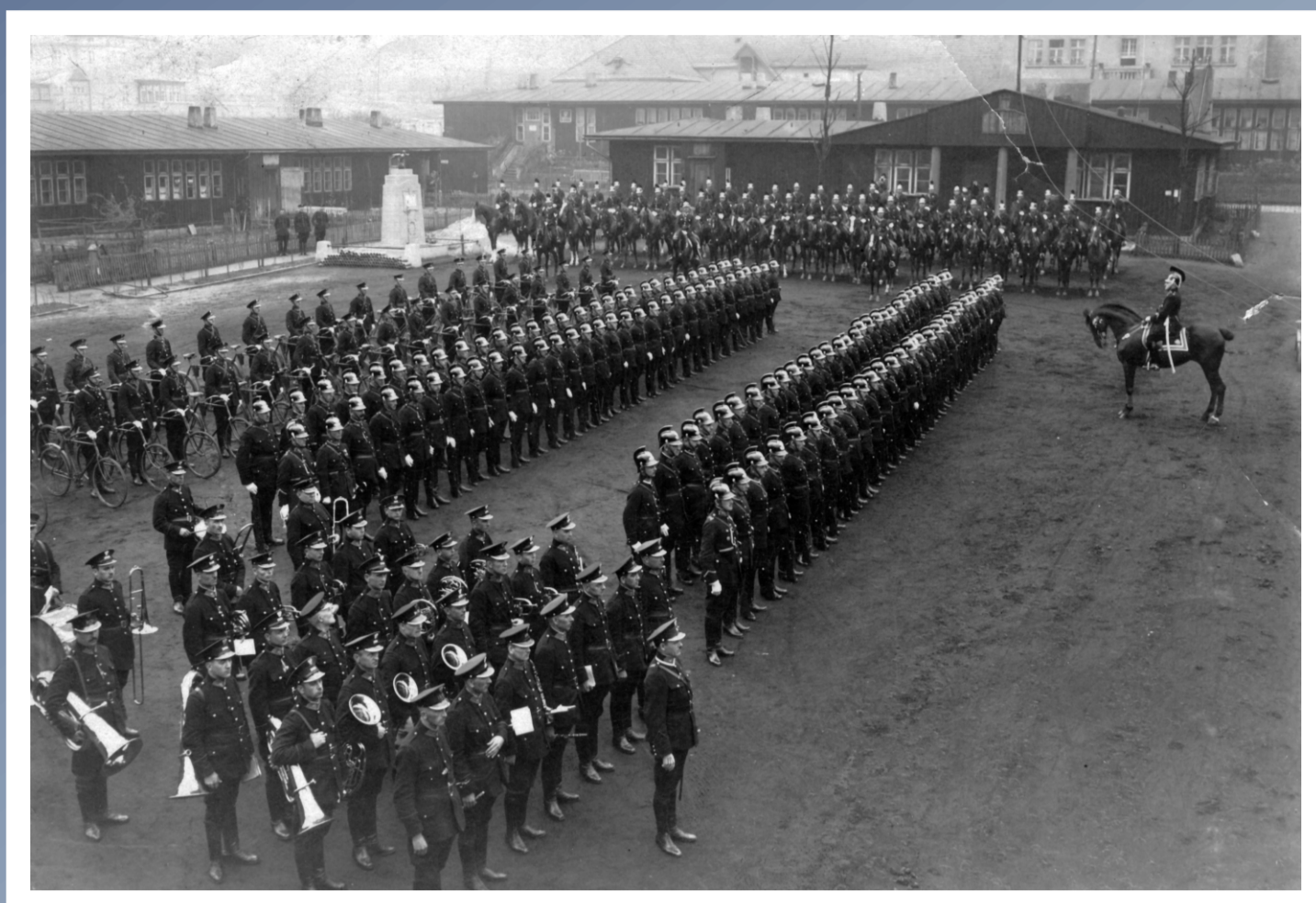
Uroczysty apel z okazji trzeciej rocznicy utworzenia Policji Województwa Śląskiego na terenie Kompani Rezerwy w Katowicach, 17 czerwca 1925 roku.