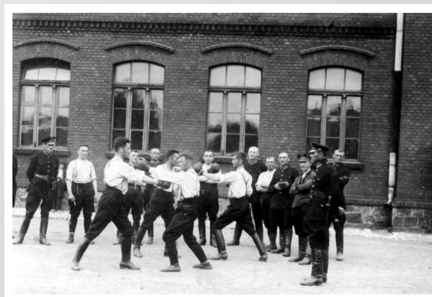
Szkolenie bokserskie w ramach zajęć z samoobrony w Szkole Policji PWŚI. w Świętochłowicach. Rok 1923.