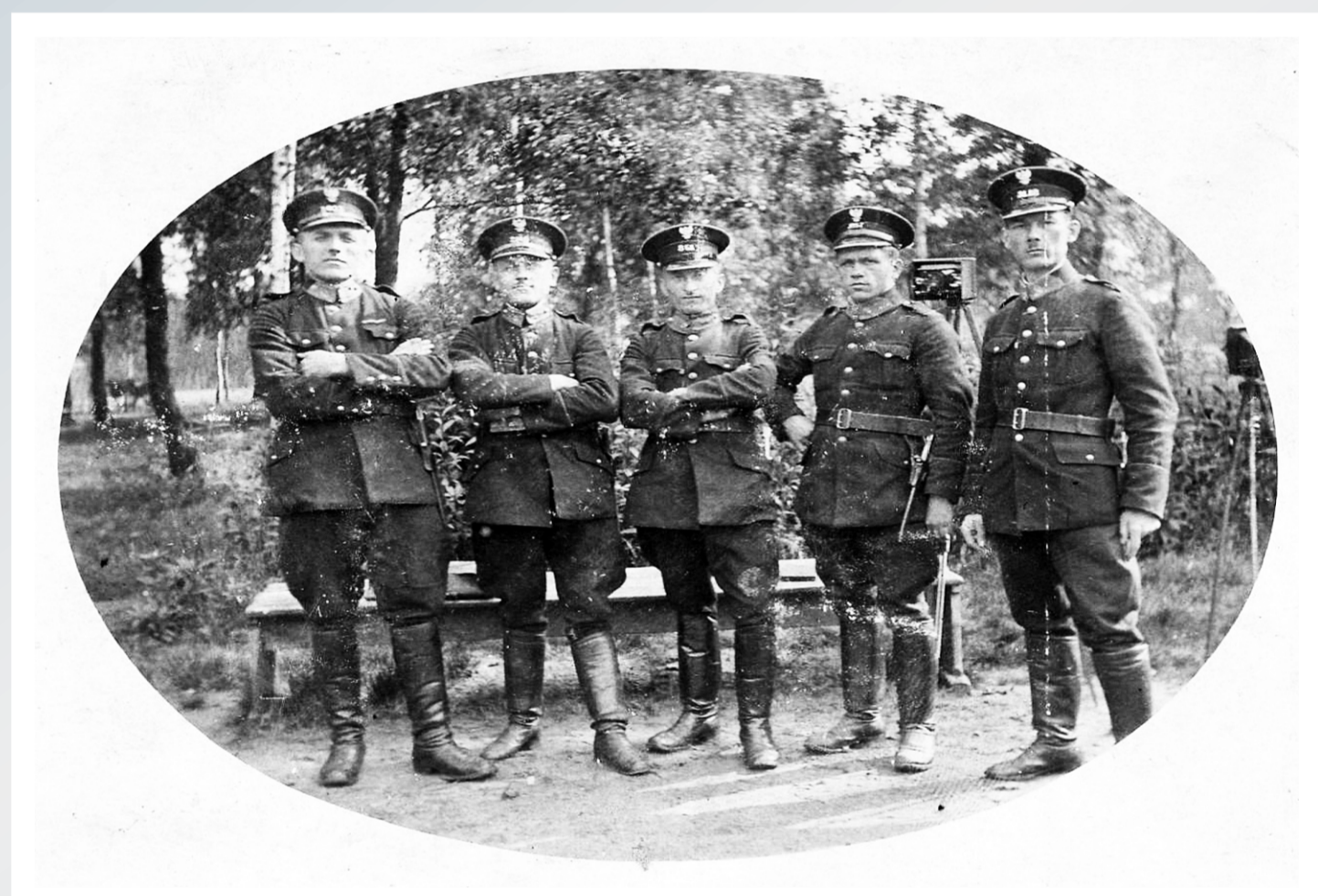
Uczestnicy I-go Kursu Fotograficznego w Szkole Policji Województwa Śląskiego w Katowicach na zajęciach praktycznych na terenie Parku Kościuszki w Katowicach. Rok 1925.

„Przysięgam, że podczas mej służby w Policji Górnego Śląska posłusznym będę przełożonym mym we wszystkim, co dotyczy służby, do której powołany jestem; że będę szczerze i lojalnie służyć Komisji Międzysojuszniczej Rządzącej i Plebiscytowej Górnego Śląska i przyjmować rozkazy tylko od niej lub od jej przedstawicieli; że nie będę brał udziału w żadnej propagandzie, bądź to pośrednio, czy bezpośrednio; że będę przestrzegał zupełną neutralność w czynach i słowach; że w żaden sposób nie będę popierał współobywateli mej narodowości przy okazji manifestacji publicznych; i że przy spełnianiu mego urzędu korzystać będę z władzy mi powierzonej jedynie celem utrzymania porządku i wykonania praw”.